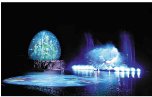
▲ウォーターマッピングショー 「AGUA(アグア)」