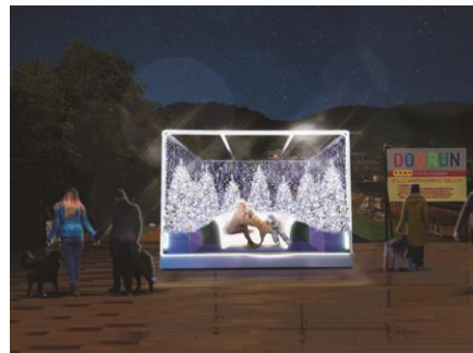
▲場所: ドッグラン前 ※わんわん冬ラグーナ用のフオトスポットです。