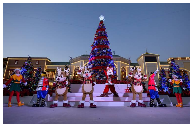
▲「ライトアップセレモニー」