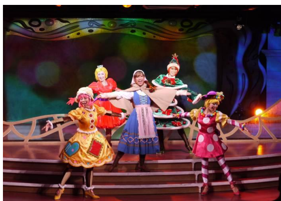
▲「ホーリークリスマス」