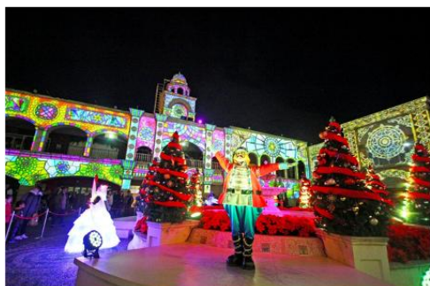
▲360° 3D マッピング 「NEIGE(ネージュ)」