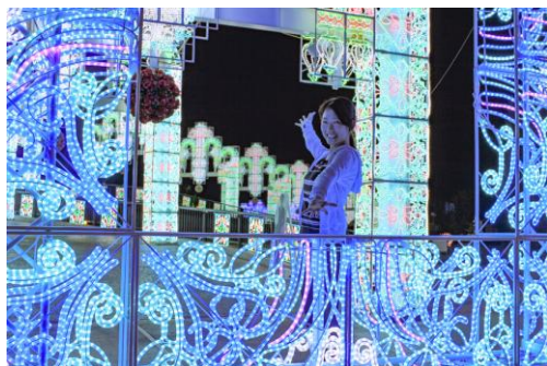
▲場所: 幸運のレインボーアーチ