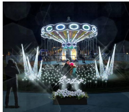
▲場所: スイム&スイング