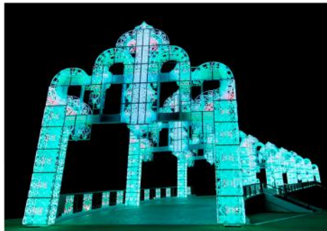
▲100万球のイルミネーションアーチ 「幸運のレインボーアーチ」