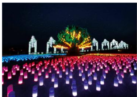
▲シンボルツリーと ランタンイルミネーション 「光の草原」