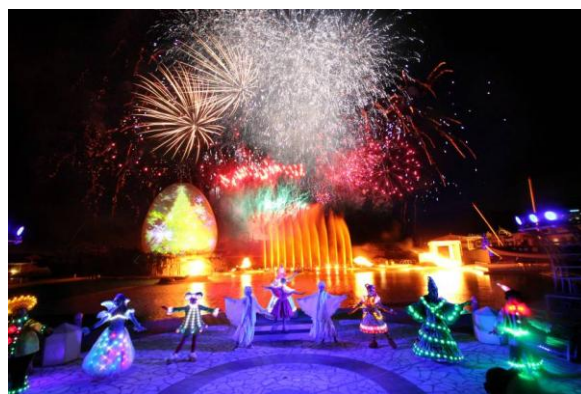
▲花火スペクタキュラ 「ラ・レーヴ・デ・ノエル」