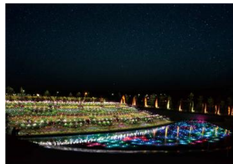
▲フラワーイルミネーション 「ジュエルガーデン」