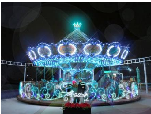
▲場所: マーメイドカレースル