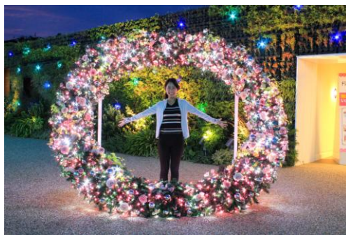
▲場所: フラワーラグーン