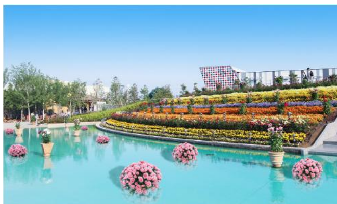
▲バラのフラワーボール ※イメージ