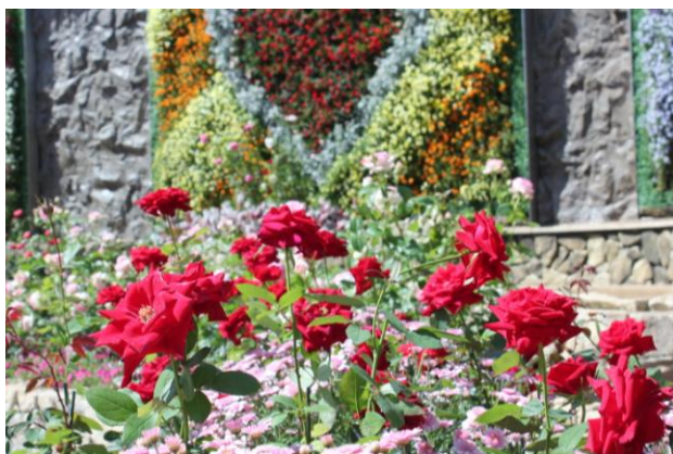
▲昨年登場した新品種「ラグーナテンボス」

※「ラグーナテンボス」は2018年に新登場したラグーナテンボスオリジナル品種のバラです。