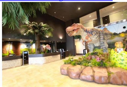
▲変なホテル ラグーナテンボス