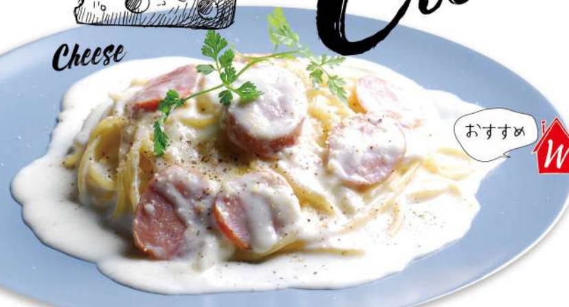
サルシッチャ(ソーセージ)のチーズクリーム