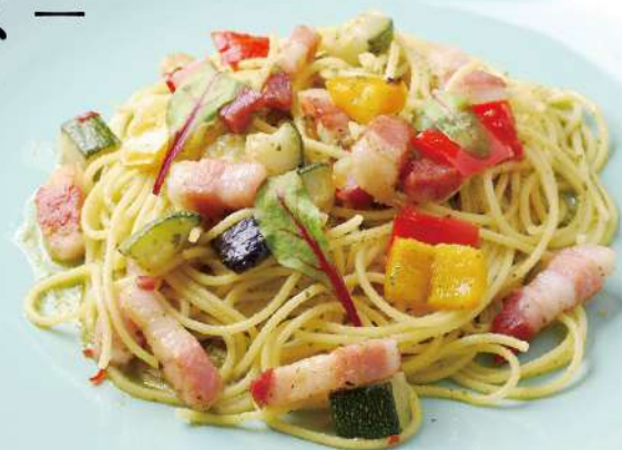
パンチェッタと彩野菜のジェノバ風