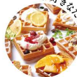
オーダー制 焼き立てワッフル