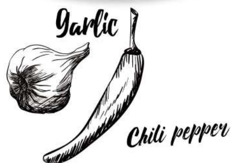
Garlic Chili pepper