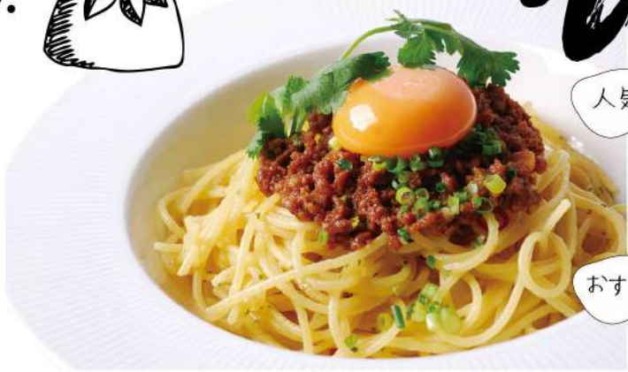
和風肉みそポロネーゼ