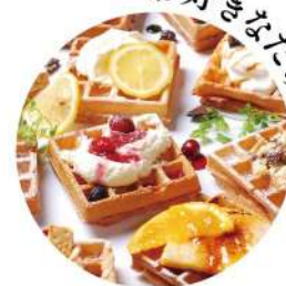
オーダー制 焼き立てワッフル