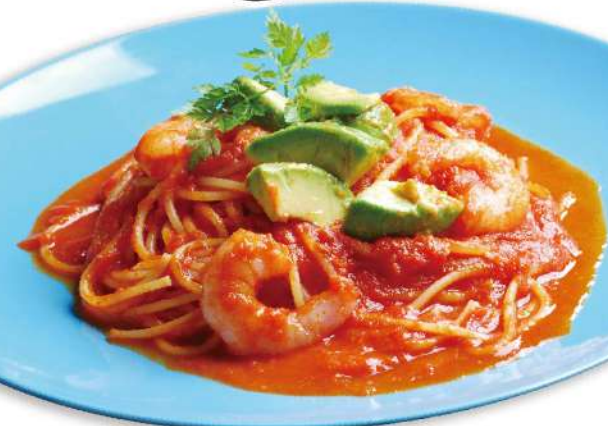
海老とアボカドのポモドーロ