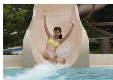
地上約15mから回転しながら滑る ウォータースライダー 「ゼウスの稲妻」