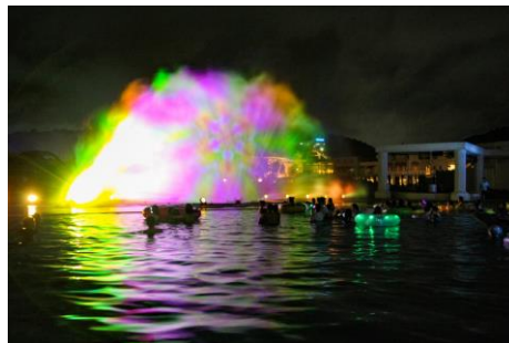
▲花火スペクタキュラ「フレイム」