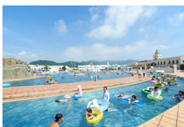
幅広い年齢が楽しめる ラグナシア定番の全長230mの 流れるプール 「ウロボロスの河」