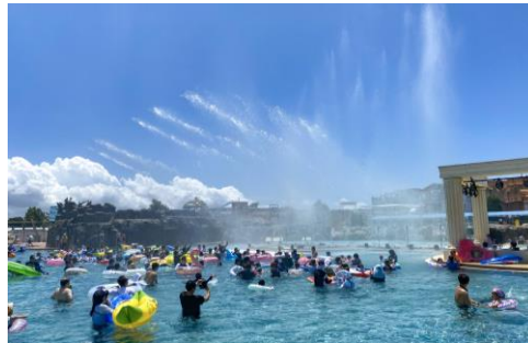
▲スプラッシュファウンテン