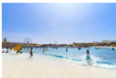
日本最大級の最大波高1mの 波の出るプール 「ジョイアマーレの浜辺」