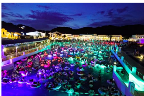
「ジョイアマーレの浜辺」