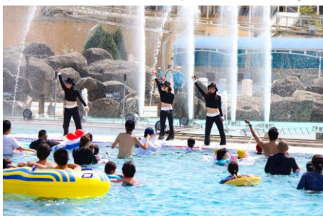
▲スプラッシュビクス