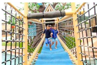
プールの中に恐竜が現れた 楽しい仕掛け満載のキッズプール 「ジュラグーン」