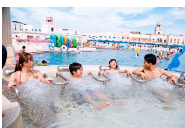
プールで冷えた体を温めて 休憩できる温水ジャグジー 「セイレーンの泉」