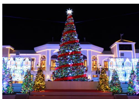
⑦ クリスマスツリー

ラグナシア全体を見渡すことが出来るテラスの天井には、まるでステンドグラスのようなイルミネーションが広がり、やわらかい光が降り注ぎます。