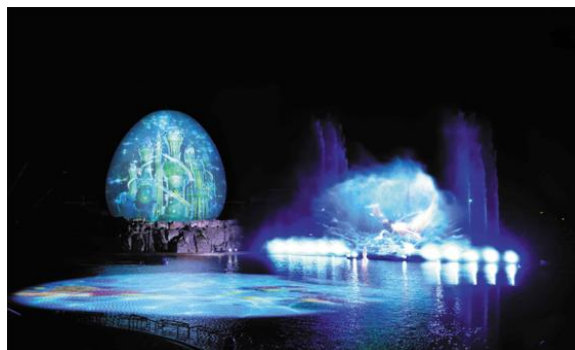
▲ウォーターマッピングショー「AGUA(アグア)」