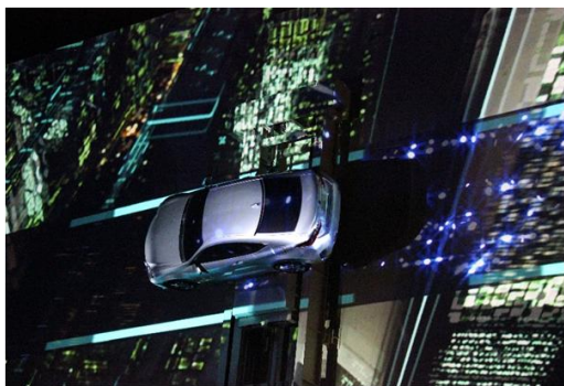
▲カーアクションマッピング「AMAZE(アメイズ)」