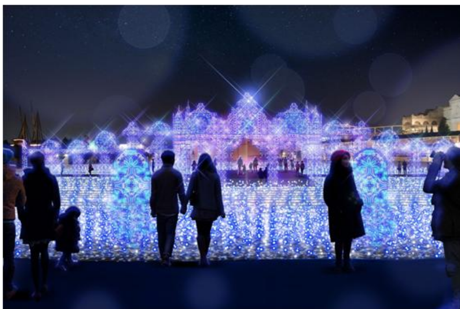
▲水上イルミネーション「青の宮殿」

注目は、今年登場の水上イルミネーション「青の宮殿」。一面に輝く光の海と中央で煌めく青い宮殿が水面に映り込み、壮大な青の世界が広がります。その他、最新技術を取り入れた水中イルミネーションで光の花を造り出す「ジュエルガーデン」、100万球が輝くイルミネーションアーチ「幸運のレインボーアーチ」を含む4つのイルミネーションと、360° 3Dマッピングの冬季限定「NEIGE(ネージュ)」を含む3つのプロジェクトマッピングが今年も登場し、冬のラグーナを彩ります。