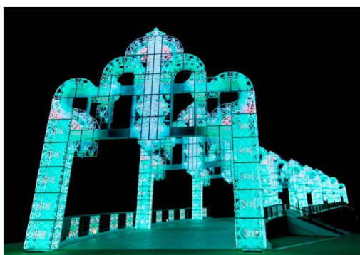
▲100万球のイルミネーションアーチ「幸運のレインボーアーチ」