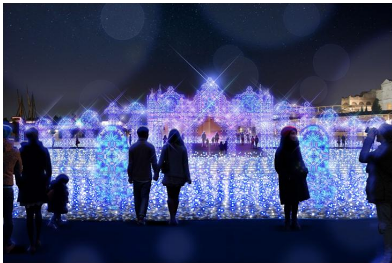
NEW ▲水上イルミネーション「青の宮殿」 ※イメージ