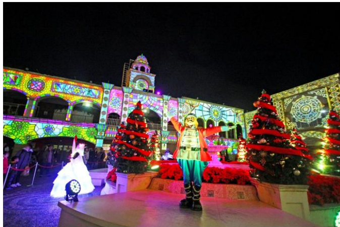
▲360° 3D マッピング「NEIGE(ネージュ)」