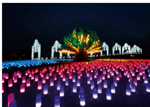
▲シンボルツリーとランタンイルミネーション「光の草原」